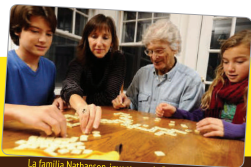
La familia Nathanson, inventores de BANANAGRAMS

Importado y Distribuido para España y Portugal por: Lúdilo S.L. C/Pouet de Nasio s/n, Parcela 5, Nave B2, Sector 14. 46190. Ribarroja del Turia, Valencia, Spain